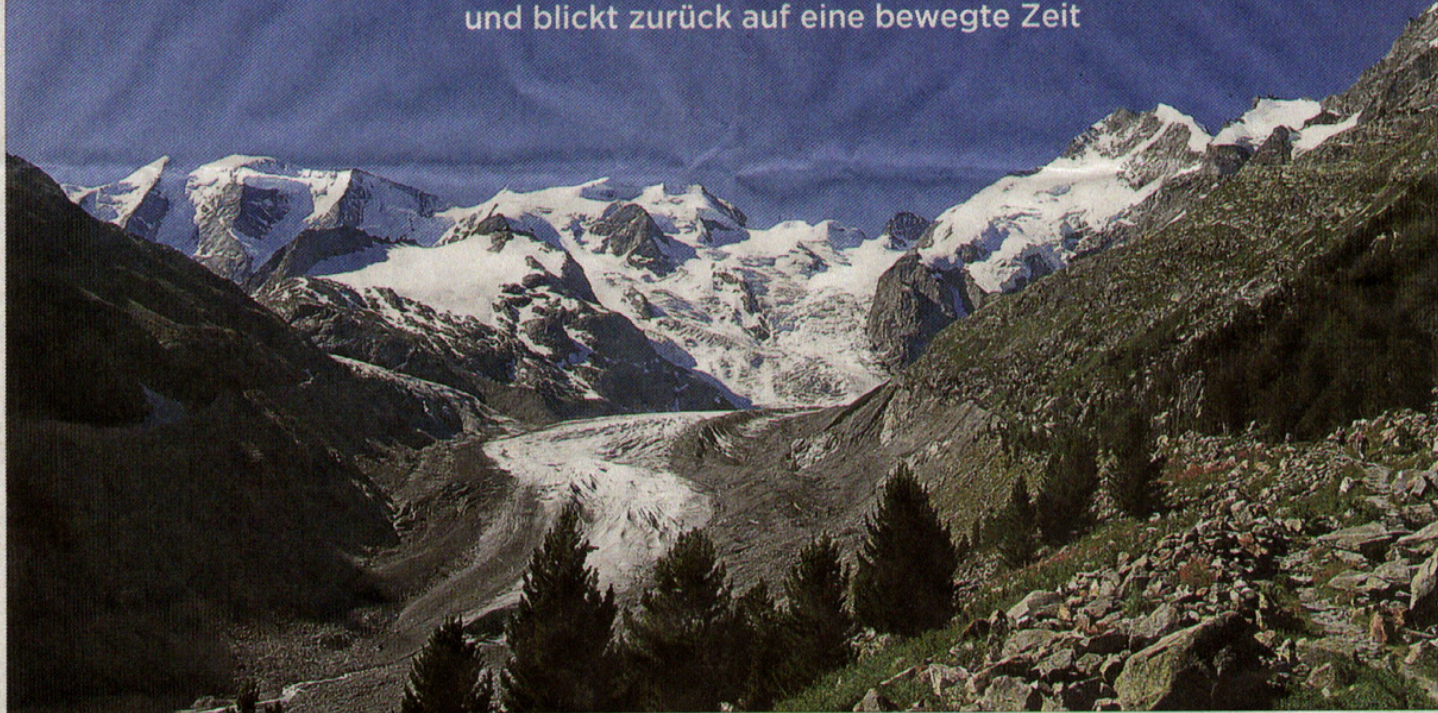
Blick auf die Bernina Gruppe, die Norbert Weber ganz besonders gefällt.

Norbert Weber hat viele Jahre den DAV Fulda geleitet und blickt zurück auf eine bewegte Zeit